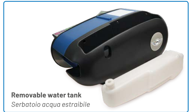
Removable water tank Serbatoio acqua estraibile

DAT 1 and DAT 2 can use all types of standard or reinforced gummed paper with a width from 20 mm to 100 mm and a maximum external reel diameter of 250 mm. The cutting length is adjustable from 100 mm to 999 mm. The unwinding speed is 1.0 m/sec. and allows high production volumes.